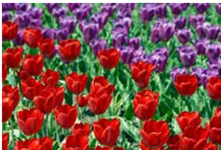
Rogerius Caes en Anna Detollenaere Brijlanten Bruiloft (Kerkhove 14/07/1950)