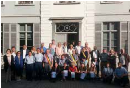
Brevetuitreiking Rode kruis 19/06