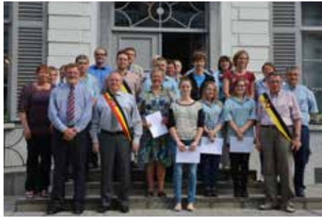
Brevetuitreiking Rode Kruis 21/06/2014