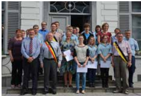
Brevetuitreiking Rode Kruis 21/06/2014