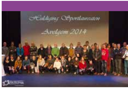
Huldiging sportlaureaten 30/01/2015