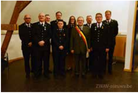
Huldiging brandweer 24/01/2015