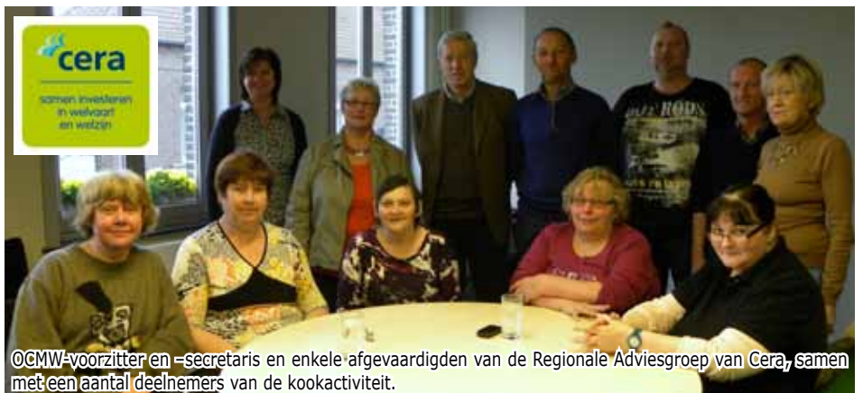
OCMW-voorzitter en -secretaris en enkele afgevaardigden van de Regionale Adviesgroep van Cera, samen met een aantal deelnemers van de kookactiviteit.

ZOHRA organiseert deze activiteit in het Sociaal Huis, in samenwerking met Samenlevingsopbouw West-Vlaanderen. Dankzij de steun van de Regionale Adviesraad van Cera konden de keuken en de zaal ingericht worden, zodat wij onze kookactiviteit op een veilige, hygiënische en comfortabele manier kunnen laten plaatsvinden.