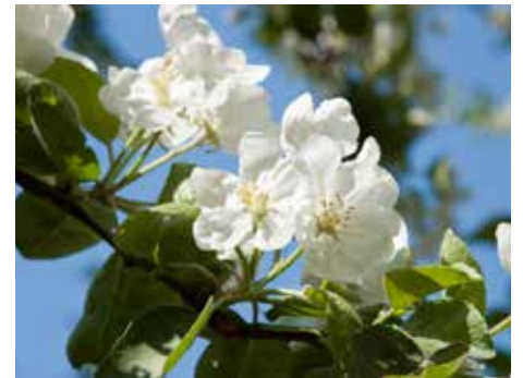
Jacques Houttequiet en Rita Eggermont Gouden Bruiloft (Zwevegem 30/04/1965)