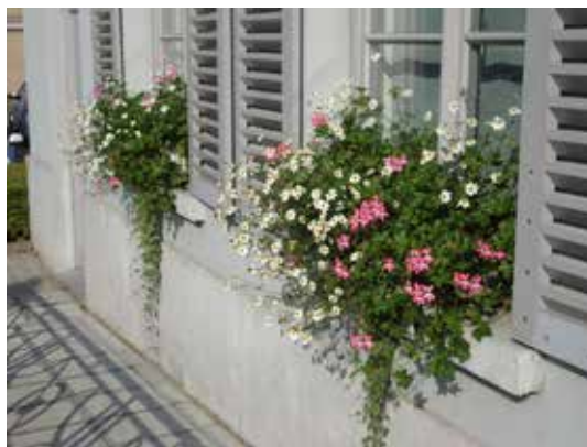
De gevelbebloeming aan het gemeentehuis met de roze hanggeranium (Pelargonium 'Balcon Desrumaux').

Deze planten zijn in diverse combinaties te zien in de straatbloembakken, de hangmanden, de brugbloembakken en de gevelbebloeming aan het gemeentehuis.