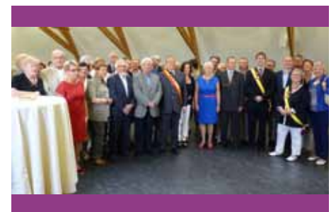
Ontvangst 60-jarig bestaan OKRA trefpunt Avelgem 15/06/2013