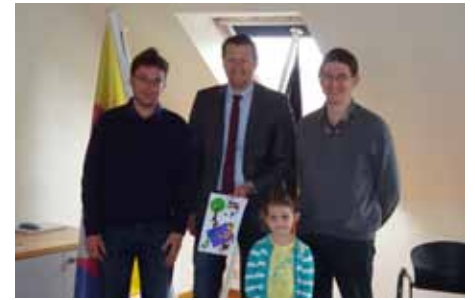
Prijzuitreiking tekenwedstrijd de Lijn 22/05/2013