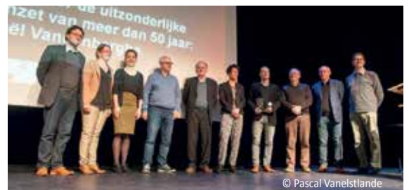
Huldiging Sportlaureaten (05.02.2016)