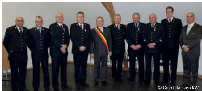
Huldiging Brandweer (23.01.2016)