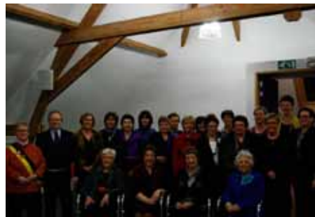
Ontvangst 60-jarig bestaan Markant 13/12/2012