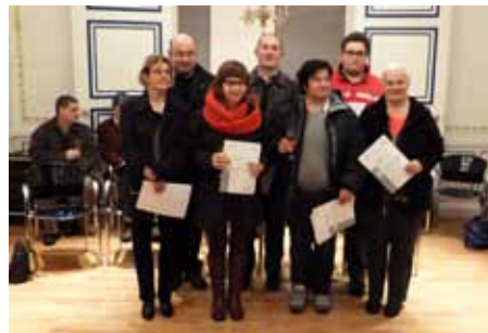
Brevetuitreiking Rode Kruis 19/01/2012