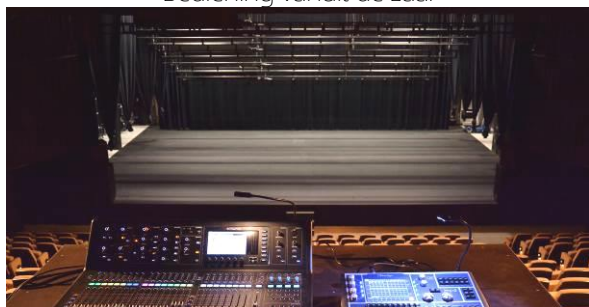
Bediening vanuit de zaal