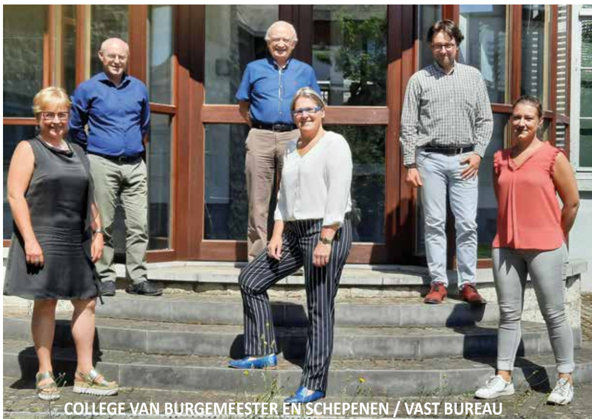
COLLEGE VAN BURGEMEESTER EN SCHEPENEN / VAST BUREAU