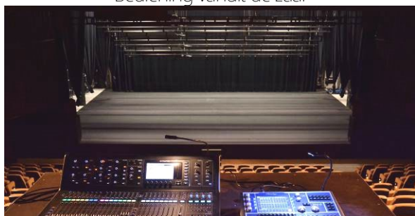
Bediening vanuit de zaal