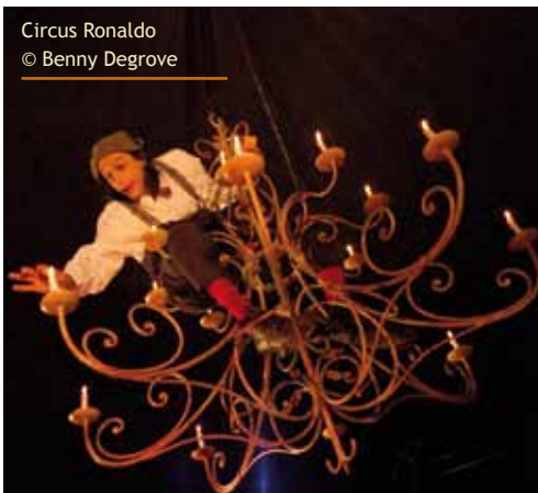
Circus Ronaldo

De reductieprijs geldt voor mensen jonger dan 26 of voor 55-plussers. De reductieprijs geldt ook voor abonnees die een kaart voor een voorstelling buiten het abonnement kopen. Voor de jeugdfilms is er een korting voor Grabbelpassers.