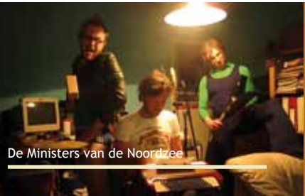
De Ministers van de Noordzee