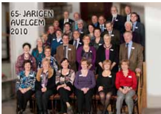
Ontvangst 65-jarigen 20/11/2010