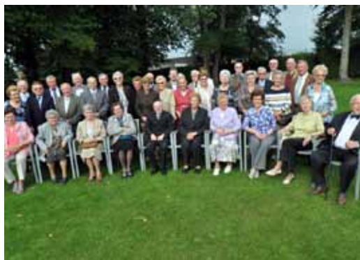
Ontvangst 80-jarigen 23/09/2010