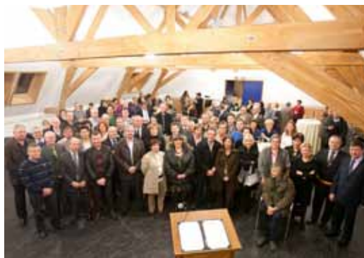
Ontvangst 50-jarigen 10/11/2010