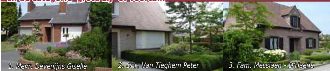
1. Mevr. Devenijns Giselle