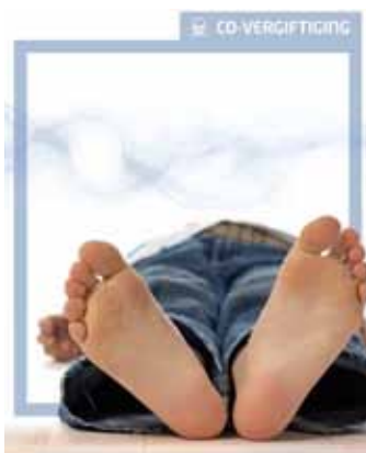
Hou de stille moordenaar buiten!

Jaarlijks sterft meer dan 1300 mensen in ons land slachtoffer van CO-vergiftiging. CO is een dodelijk gas dat je niet ziet, ruikt, proeft of voelt. Het is een onzichtbaar, kleurloos, smaakloos, niet-toxisch gas dat je niet kunt zien, ruiken, proeven of voelen. Het is een onzichtbaar, kleurloos, smaakloos, niet-toxisch gas dat je niet kunt zien, ruiken, proeven of voelen. Het is een onzichtbaar, kleurloos, smaakloos, niet-toxisch gas dat je niet kunt zien, ruiken, proeven of voelen.