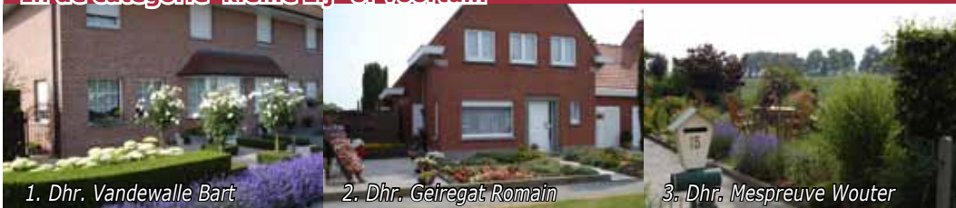
1. Dhr. Vandewalle Bart