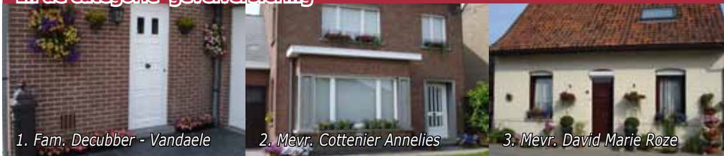
1. Fam. Decubber - Vandaele