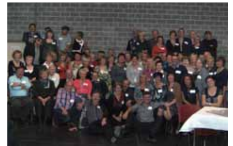
Ontvangst 55-jarigen 15/10/2011