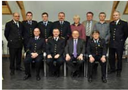
Huldiging brandweer op 22 januari 2011