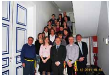
Brevetuitreiking Rode Kruis 03/12/2011