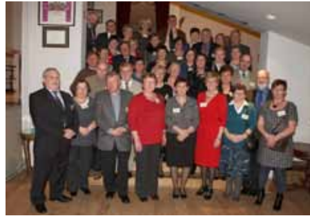
Ontvangst 60-jarigen 19/11/2011